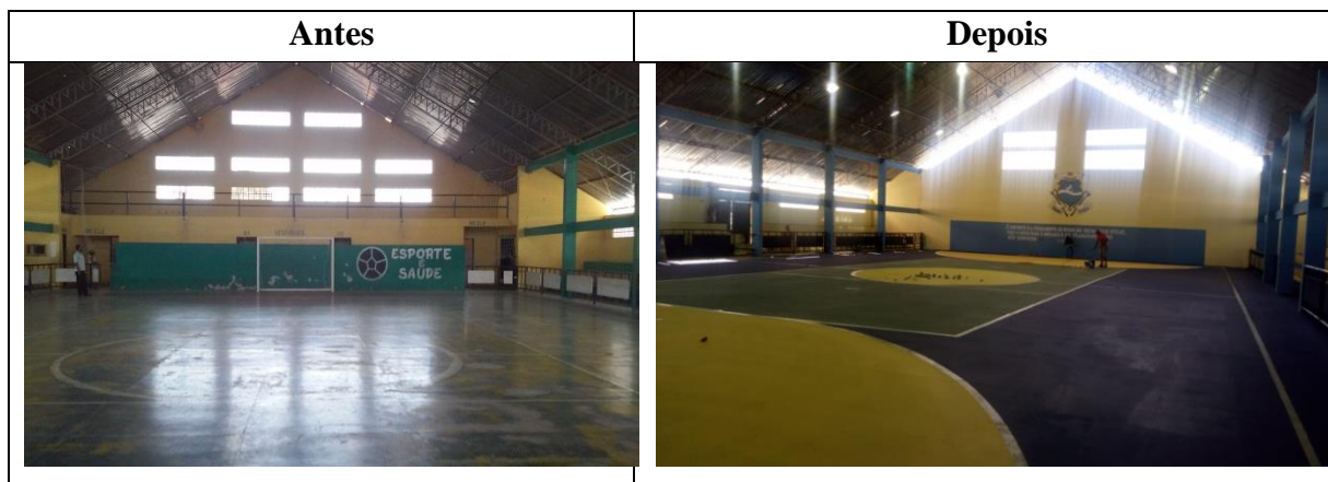
Figura 5 – Reforma & Pintura do piso do Ginásio Poliesportivo de Fernando Pedroza.