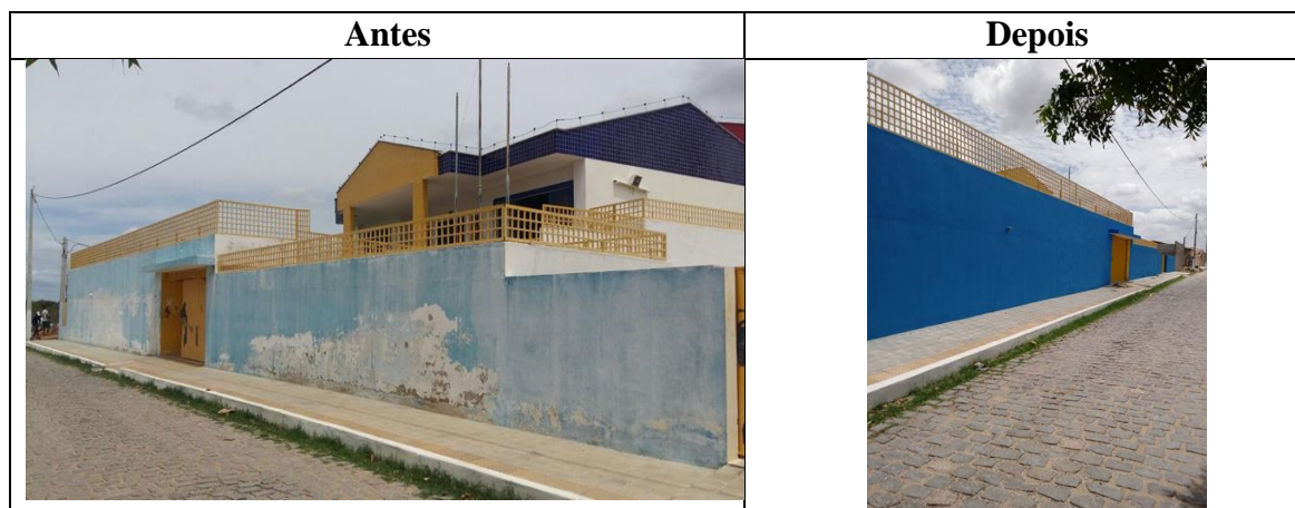
Figura 6 – Reforma da fachada frontal com substituição de portas e pinturas no CEMEI.