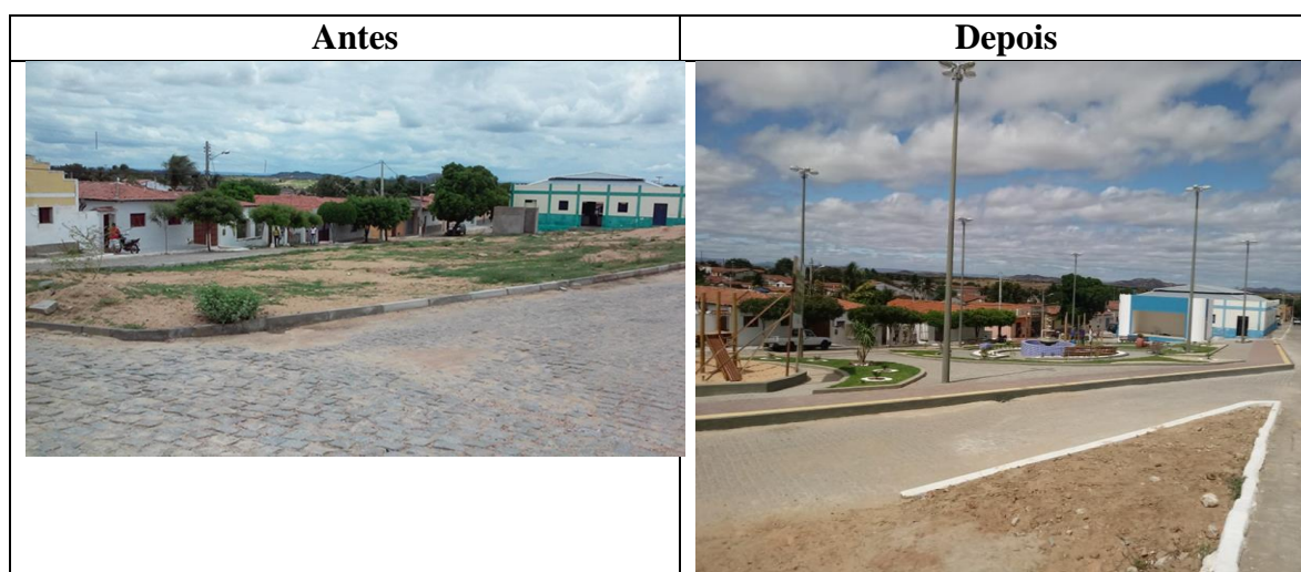
Figura 8 – Conclusão da Praça José Salviano da Cruz.