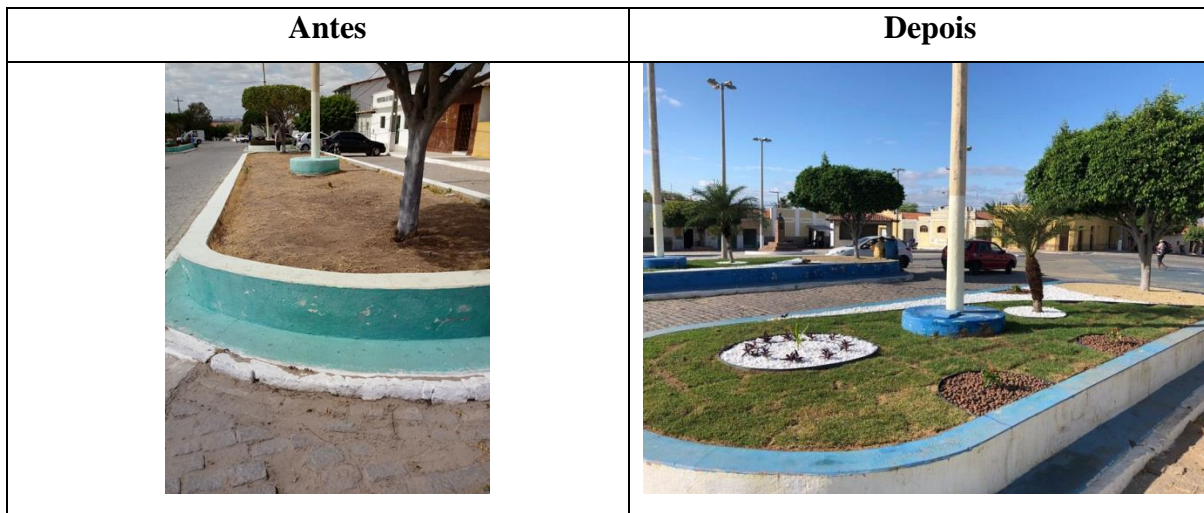
Figura 4 – Reforma e revitalização dos canteiros e jardins do Município de Fernando Pedroza.