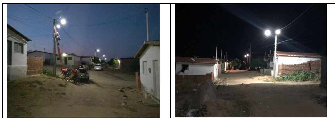
Figura 7 – Implantação de iluminação Pública no conjunto do bairro Miguel Trindade.