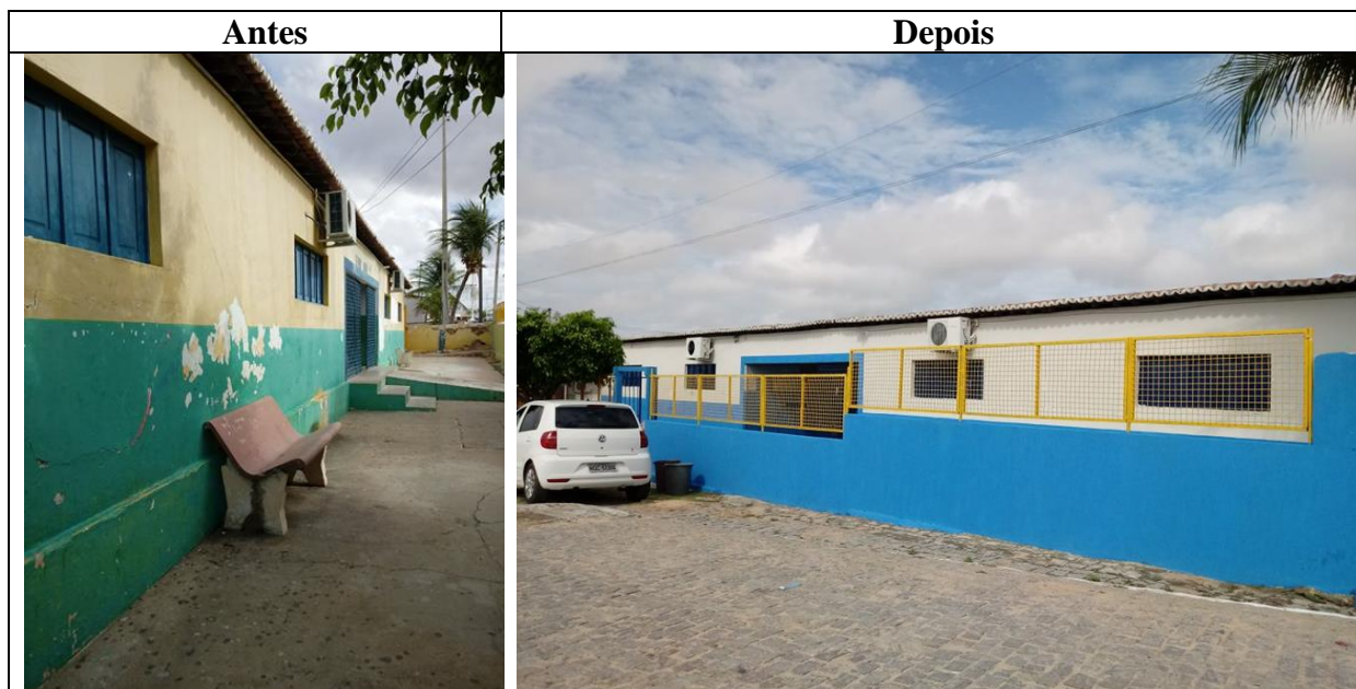
Figura 2 – Reforma da Escola Municipal Fabrício Pedroza.